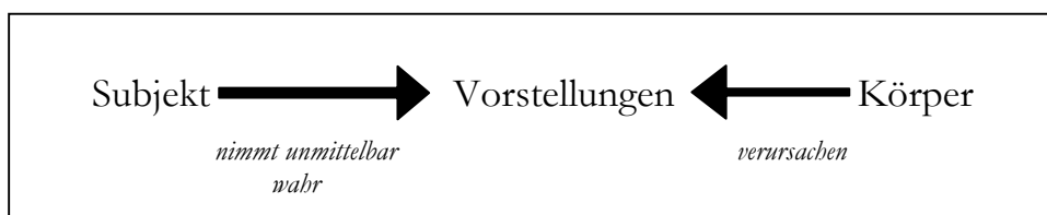
Abb. 1: Transzendentaler Realismus

Sehen wir uns Kants Argumentation etwas genauer an. Sie basiert darauf, dass Kant dem transzendentalen Realisten ein bestimmtes Modell davon unterstellt, wie wir von der Existenz von an sich existierenden Körpern wissen können. Dieses Modell kann man in folgendem Schaubild zusammenfassen: