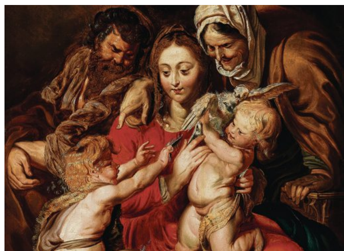
Peter Paul Rubens (1577–1640) und Werkstatt (Ausschnitt), € 350.000 – 500.000, Auktion 10. November

Auktionswoche 4. – 11. November Alte Meister Gemälde des 19. Jahrhunderts Antiquitäten